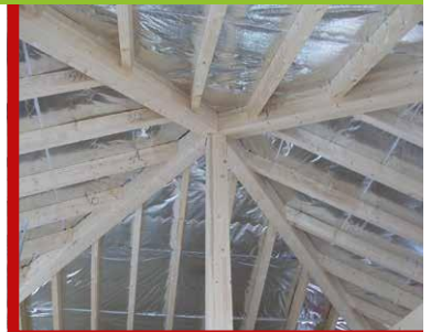
... UNTERSPIANNBAHN IN EINEM