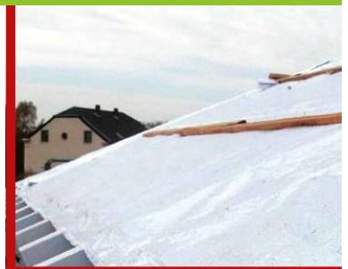
... DÄMMUNG UND...