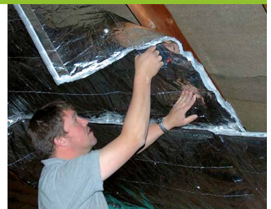
... DÄMMUNG UND...