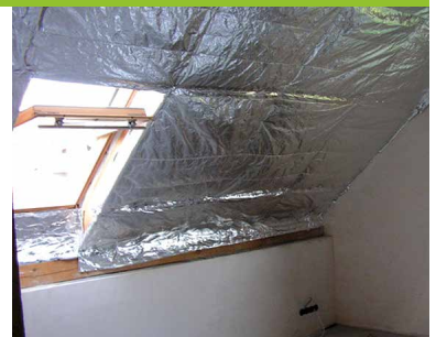
... DAMPFBREMSE IN EINEM